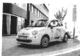
Fiat 500 1.3 15000 km/rok 110.00 €