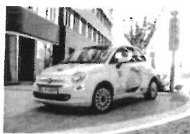
Fiat 500 1.1 15000 km/rok 6.00 €