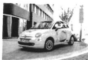
Fiat 500 1.3 15000 km/rok 60.00 €