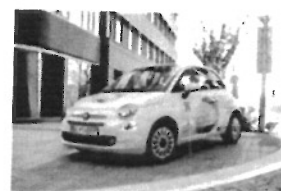
Fiat 500 1.3 15000 km/rok 150.00 €